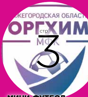
МИНИ-ФУТБОЛ Поставили мат «Динамо»