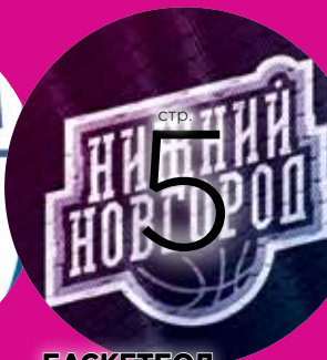
БАСКЕТБОЛ Вторые в Кубке России