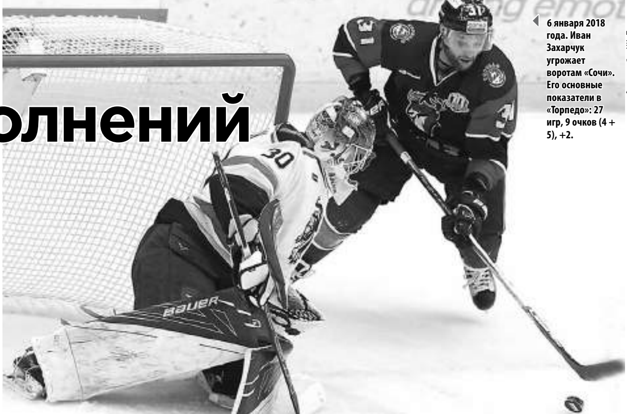
6 января 2018 года. Иван Захарчук угрожает воротам «Сочи». Его основные показатели в «Торпедо»: 27 игр, 9 очков (4 + 5), +2.

Между тем сайт «Торпедо» продолжил знакомить болельщиков с